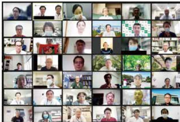
全国の医療専門家が連携・情報共有

JCCGでは、全国の医療専門家が連携・情報共有し、 グループスタディや中央診断を行うことで、 正しい診断に基づいた 最善の小児がん治療を目指しています。